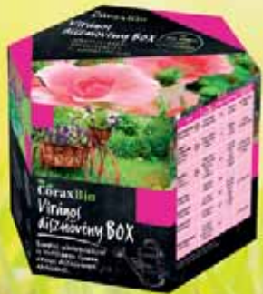
Virágos dísznövény BOX